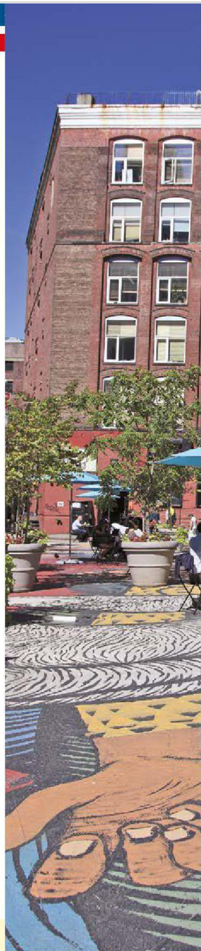
La proprietà intellettuale è riconducibile alla fonte specificata in testa alla pagina. Il ritaglio stampa è da intendersi per uso privato

Oltre le consuete tappe turistiche, come Ellis Island e Liberty Island, ci sono piccole isole meno conosciute, ma che mi sento di consigliare per un'escursione. Tra queste, City Island, Governors Island e la Roosevelt Island. City Island si trova nel distretto del Bronx ed è facilmente raggiungibile con la linea 6 della metropolitana da Manhattan o con il bus B29, direttamente dal Bronx. L'isola ospita un villaggio di pescatori e il suo famoso yacht club, oltre ai ristoranti di pesce, rinomati in tutta New York, tra cui il City Island Lobster House , il regno dell'aragosta e l' Artie's Steak and Seafood . Presso il New York Sailing Center , oltretutto, si possono seguire lezioni di barca a vela o fare escursioni al tramonto. Roosevelt Island è situata tra Manhattan e il Queens. Fermatevi un po' al Four Freedoms Park , il parco creato in memoria del Presidente Franklin D. Roosevelt, e passeggiate sulle sponde del fiume. Per la Governors Island , salite a bordo del battello NY Waterway o del NYC Ferry . Su quest'isoletta è possibile ammirare