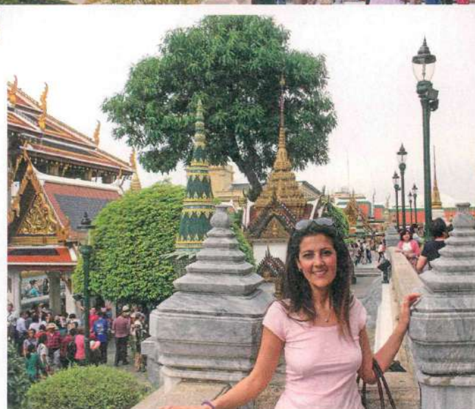
PHRA BOROM MAHA RATCHA WANG La nostra Tpc al Grande Palazzo Reale: dal 1785 è la residenza ufficiale dei re di Thailandia.

"Avevo prenotato dall'Italia lo show con cena presso l'Old Chiangmai Cultural Center (oldchiangmai.com). Abbiamo mangiato a volontà, seduti per terra come dei veri e propri thailandesi, mentre alcuni ballerini locali allietavano la cena con danze tradizionali. Veramente consigliato".