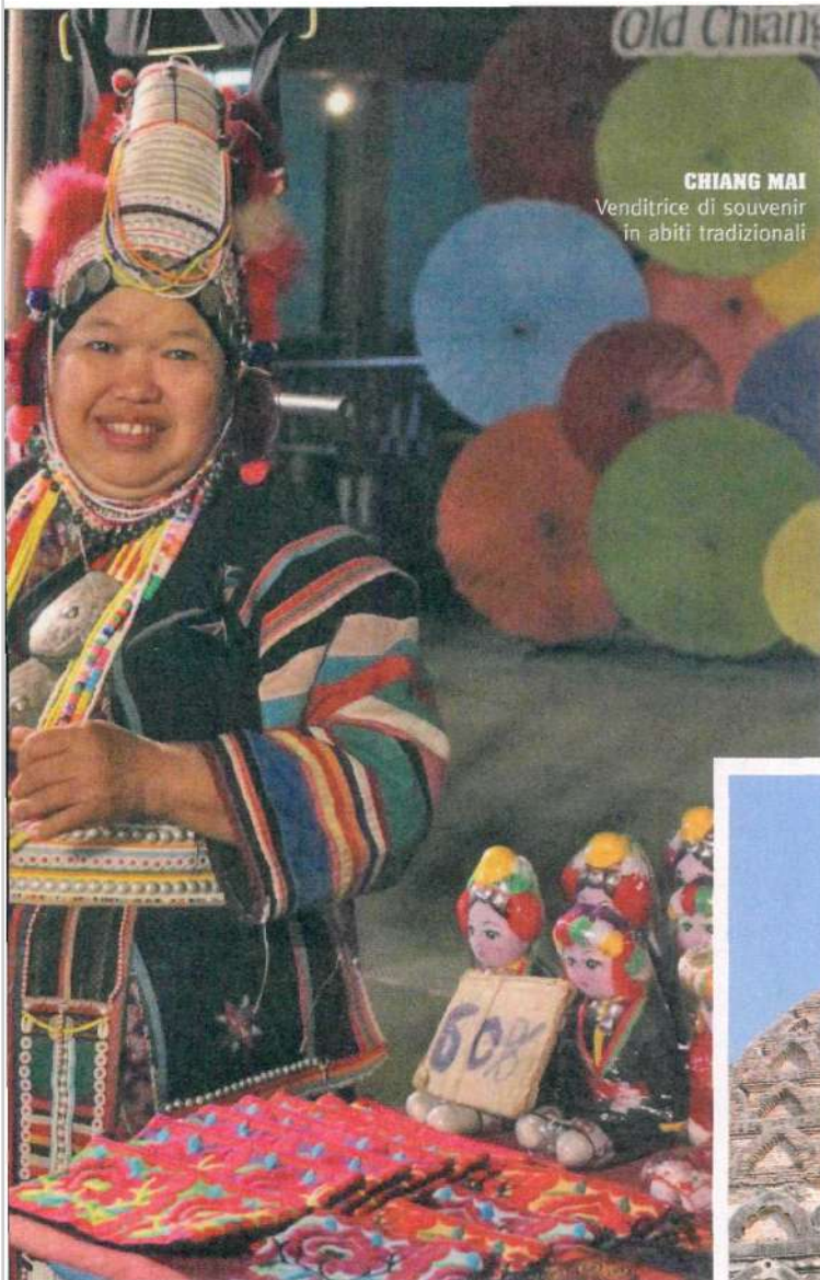
CHIANG MAI Venditrice di souvenir in abiti tradizionali