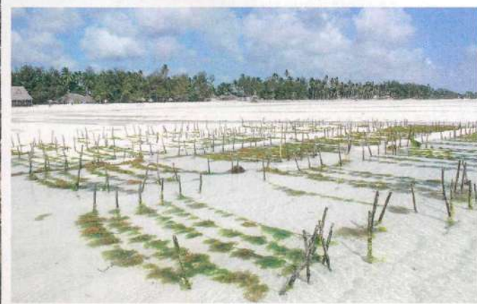
A PELO D'ACQUA Le installazioni artigianali per la coltivazione delle alghe.