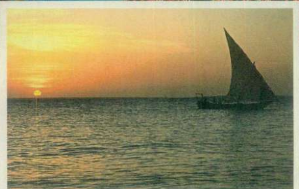
ORIZZONTE A VELA Il tramonto a Kendwa.