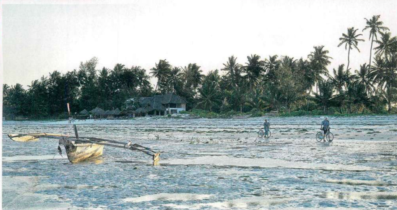
MONDO EMERSO Alcune spiagge di Zanzibar sono soggette alla bassa marea, fenomeno che consente di ammirare l'isola da un'altra prospettiva.