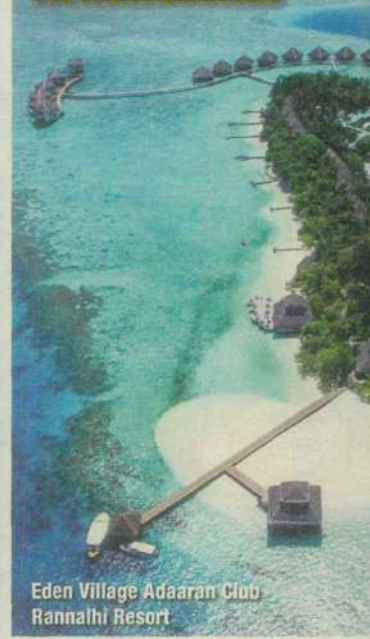
Eden Village Adaaran Club Rannalhi Resort

A piedi nudi su un'isola maldiviana, a bordo di una nave nei Caraibi oppure a Venezia, tra musei e scorci romantici