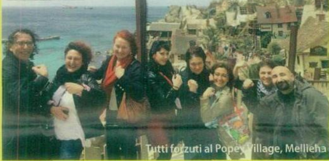
Tutti forzuti al Popey Village, Mellieha

«Una sorpresa dopo l'altra. Soleggiata e rilassata di giorno, frizzante di sera, inaspettata a tavola. Bello perdersi nei vicoli tra le dimore patrizie. Indispensabile il video di Malta Experience».