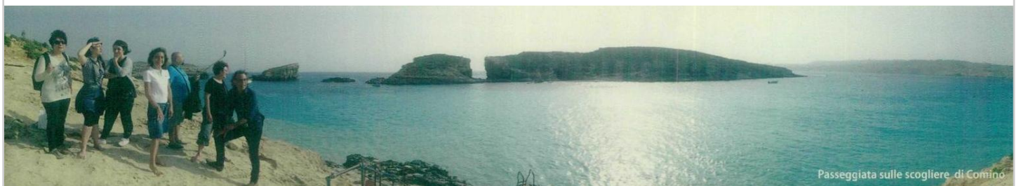
Passeggiata sulle scogliere di Comino

La proprietà intellettuale è riconducibile alla fonte specificata in testa alla pagina. Il ritaglio stampa è da intendersi per uso privato