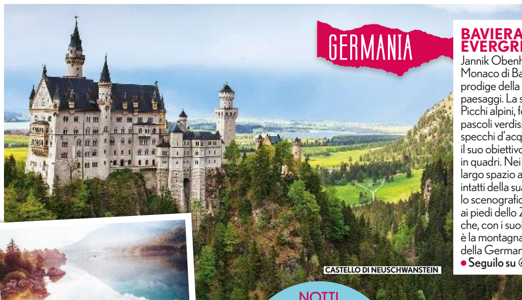
CASTELLO DI NEUSCHWANSTEIN

Hotel più auto a noleggio (12 giorni da € 1.550, volo escluso, su 4winds.it ) per scoprire da un fiordo all'altro in totale libertà le meraviglie della Norvegia, comprese le isole Lofoten e la città di Ålesund (dove si dorme al Quality Hotel Waterfront).