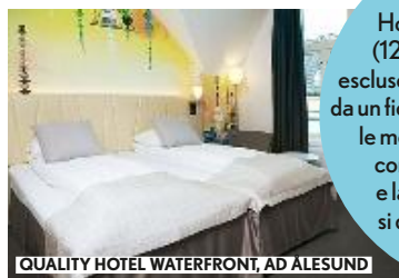
QUALITY HOTEL WATERFRONT, AD ÅLESUND