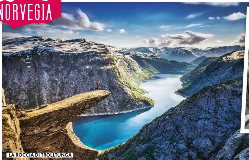
LA ROCCIA DI TROLLTUNGA