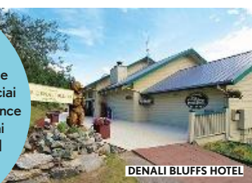
DENALI BLUFFS HOTEL

Dagli orsi del leggendario parco di Denali (dove si dorme al Denali Bluffs Hotel) ai ghiacciai che si tuffano nello stretto di Prince William, con il tour di 11 giorni proposto da Evolution Travel ( evolutiontravel.it ). Costa € 2.716 a testa, voli esclusi.