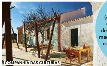
COMPANHIA DAS CULTURAS