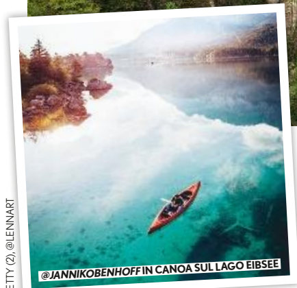
@JANNIKOBENHOFF IN CANOA SUL LAGO EIBSEE