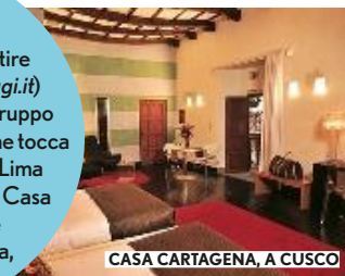
CASA CARTAGENA, A CUSCO

Se non te la senti di partire da sola, Earth ( earthviaggi.it ) propone un itinerario di gruppo di 15 giorni in fuoristrada che tocca tutti i must del Paese, da Lima a Cusco (dove si dorme a Casa Cartagena). Quote da € 2.850 a persona, voli esclusi.