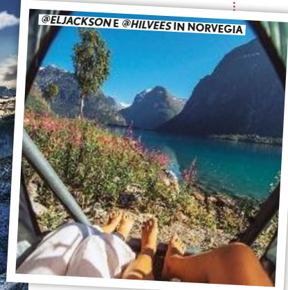
@ELJACKSON E @HILVEES IN NORVEGIA