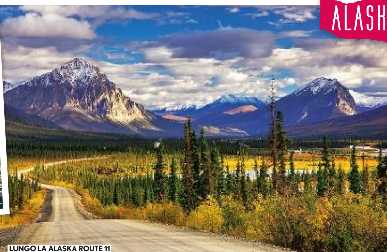
LUNGO LA ALASKA ROUTE 11