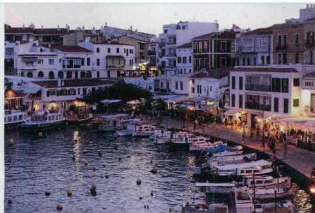
Barche nel porto di Mahón, Minorca.