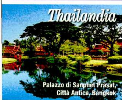
Palazzo di Sanphet Prasat, Città Antica, Bangkok

Sette notti in formula all inclusive in camera doppia Deluxe Tropical a partire da € 1.381 a persona al Turisanda Club Dreams Dominicanus****, inclusi volo e trasferimenti. La struttura è posizionata in una delle località più amate per la sua naturale bellezza, Bayahibe. Pasti a buffet, snack e giornali sempre a disposizione. Il resort è dotato di spa. www.edenviaggi.it/turisanda